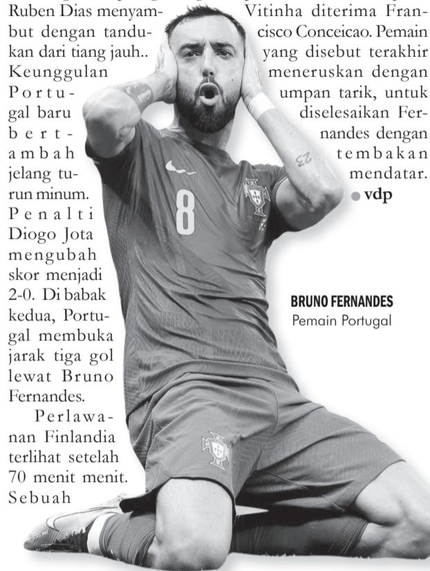
BRUNO FERNANDES Pemain Portugal