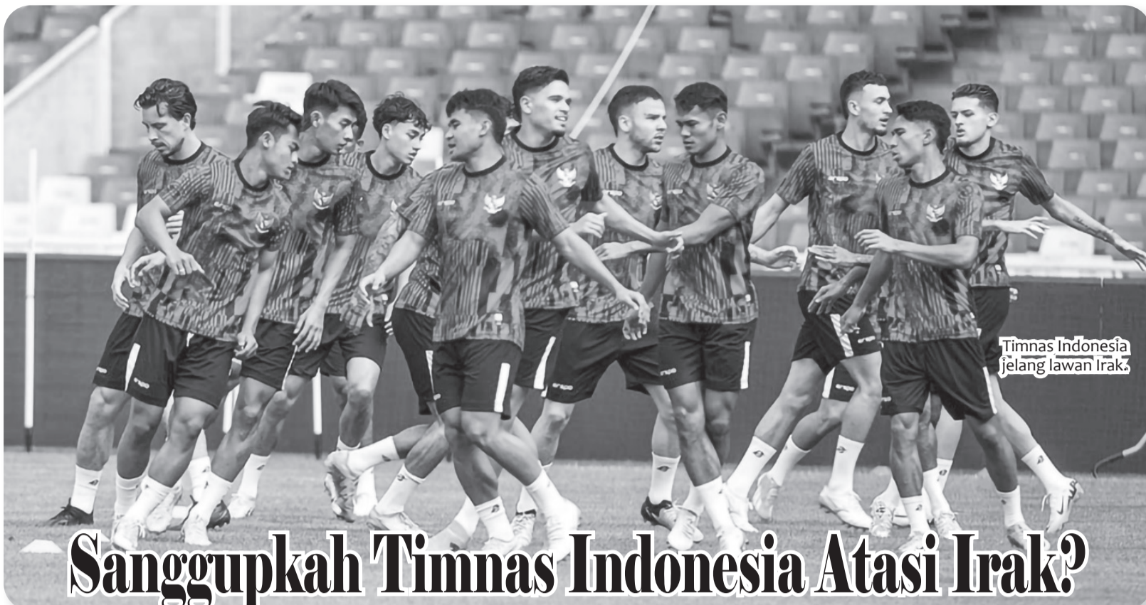
Timnas Indonesia jelang lawan Irak