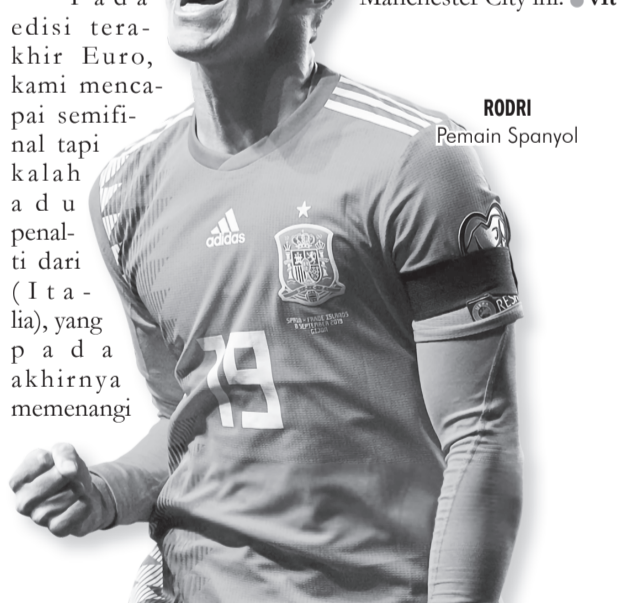
RODRI Pemain Spanyol

Rodri pun menyebutkan Italia sebagai kandidat juara. "Ini adalah tim yang biasanya tak mencetak banyak gol, tapi tetap harus dihormati. Saya rasa Italia masuk kandidat juara. Mungkin kami bukan favorit, tapi kami tahu bisa mencapai mana, dan kami ke Jerman untuk selangkah lebih dekat ke puncak," kata pemain Manchester City ini. ● vit